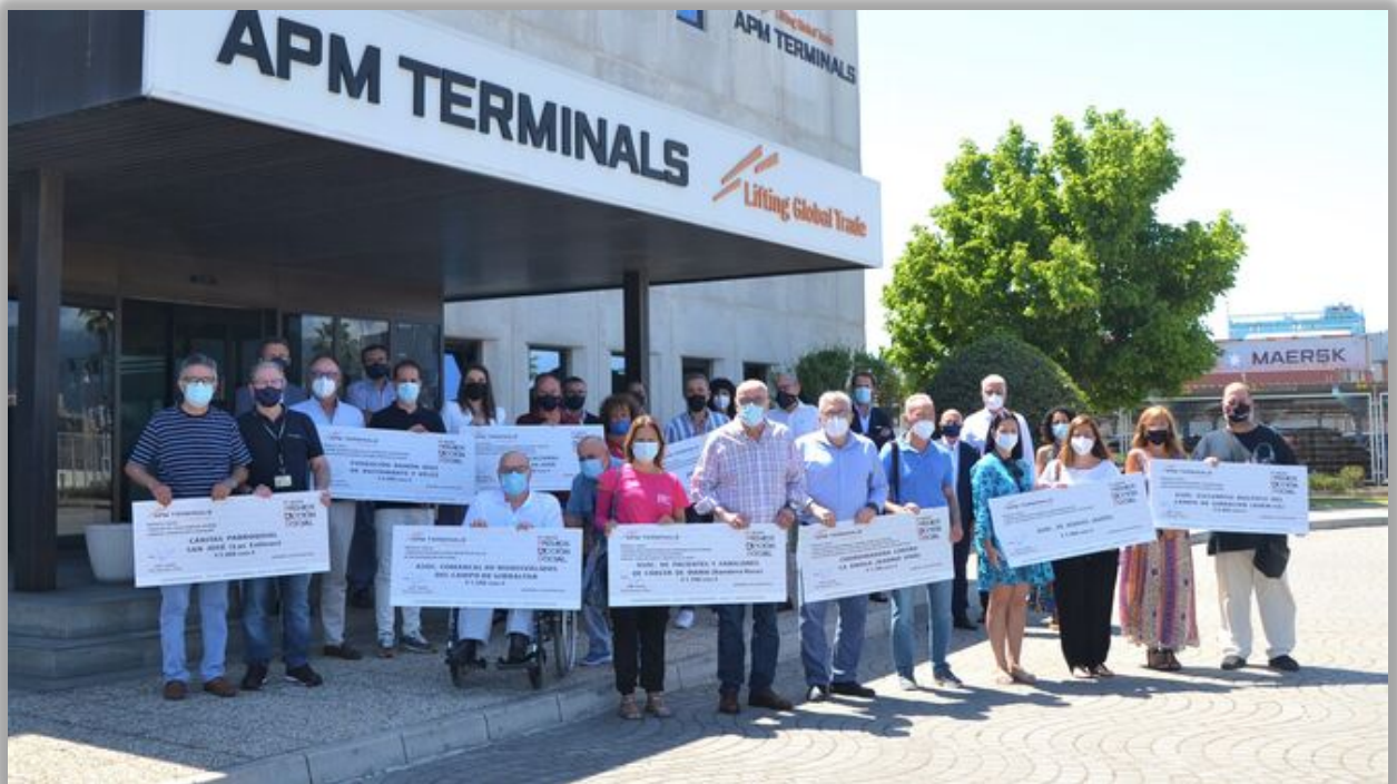
Entrega proyectos convocatoria APM Terminals.

Asociación de ámbito comarcal registrada en la Consejería de Justicia y Administración Pública de la Junta de Andalucía Sección Primera nº 6130 Asociación adherida a AEDEM-COCEMFE (Declarada de utilidad pública y miembro de la Federación Internacional de Asociaciones de Esclerosis Múltiple) Asociación miembro de FEGADI-COCEMFE. (Federación Gaditana de Personas con Discapacidad Física y Orgánica).