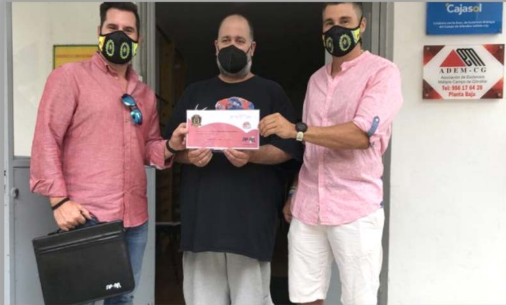
Entrega Donativo Escudos Solidarios.